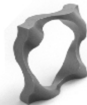
043 design: Jan Čtvrtník