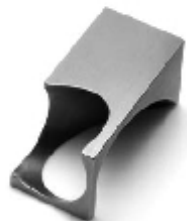
006 design: Jan Čtvrtník