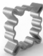
042 design: Jan Čtvrtník