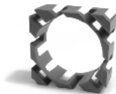
044 design: Jan Čtvrtník