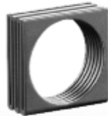
047 design: Petr Mikošek M01