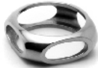
012 design: Jan Čtvrtník