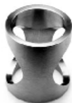
008 design: Jan Čtvrtník