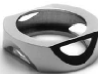
019 design: Jan Čtvrtník