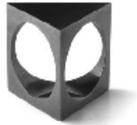
030 design: Petr Holub