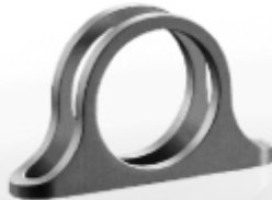
046 design: Daria Podboj René Šulc (NDR) Minus