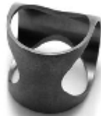
029 design: Petr Holub