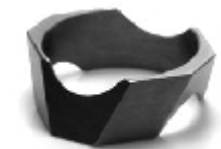
023 design: Jan Čtvrtník