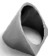
025 design: Petr Holub