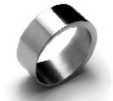
024 design: Jan Čtvrtník