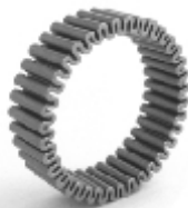
041 design: Jan Čtvrtník