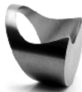
002 design: Jan Čtvrtník