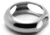
011 design: Jan Čtvrtník