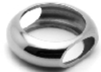
010 design: Jan Čtvrtník