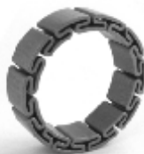
040 design: Jan Čtvrtník