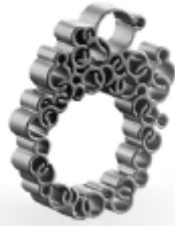
048 design: Arik Lévy Air ring