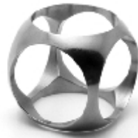
015 design: Jan Čtvrtník