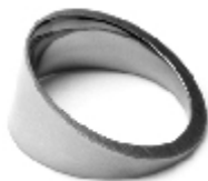
027 design: Petr Holub