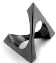
016 design: Jan Čtvrtník