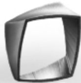
052 design: Jan Čtvrtník Sisal