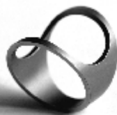
007 design: Jan Čtvrtník