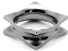
014 design: Jan Čtvrtník