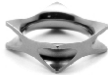
013 design: Jan Čtvrtník