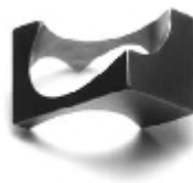
005 design: Jan Čtvrtník