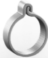
054 design: Jan Čapek Catch