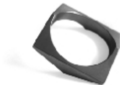
033 design: Jan Čtvrtník