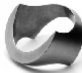
001 design: Jan Čtvrtník