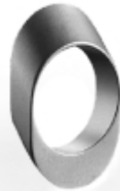
049 design: Olgoj Chorchoj Cross ring