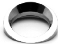
028 design: Petr Holub