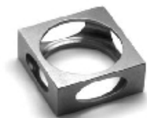
009 design: Jan Čtvrtník