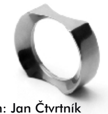
022 design: Jan Čtvrtník