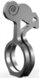
050 design: Alfredo Häberli Chameleon