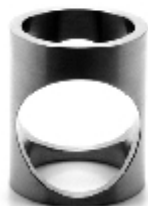
017 design: Jan Čtvrtník