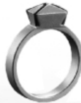
053 design: Matali Craset Monolithe